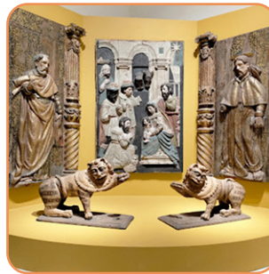
Museo de Antropología e Historia Martes a domingo 8am - 5pm