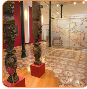
Museo de la Ciudad de Mérida Martes a domingo 9am - 6pm