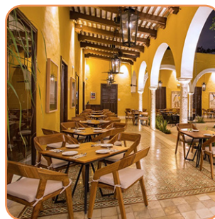
Museo de la gastronomía Lunes a domingo 9am - 11pm