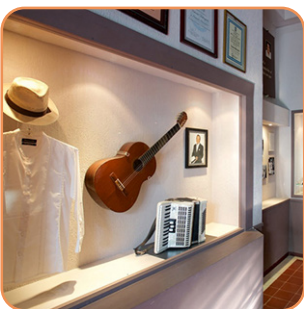
Museo de la Canción Yucateca Martes a domingo 9am - 6pm