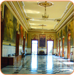
Palacio Municipal de Mérida Lunes a viernes 9am - 5pm