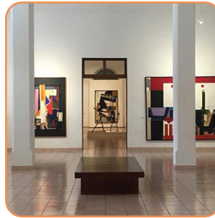
Museo de Arte Contemporáneo Ateneo Lunes a sábado 10am - 2pm