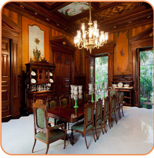
Museo Casa Montejo Martes a domingo 10am - 6pm