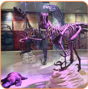
Gran Museo del Mundo Maya Miércoles a lunes 9am - 5pm